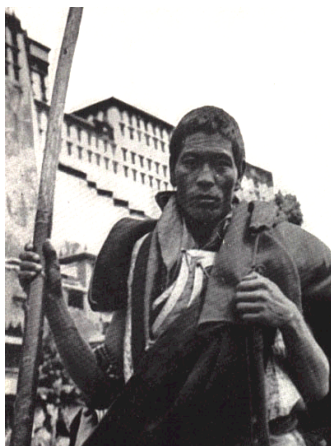
נזיר דוב-דוב מתחילת המאה ה-20

מרבית הקרבות בין הנזירים קרו כשהם נלחמו על אחד הנערים החביבים עליהם, בשביל לקיים יחסים גופניים. חשוב לומר כי יחסים מיניים בין הנזירים היו מאוד מקובלים במנזרים. כולם ידעו על כך וכולם העלימו עין - זאת משום בחברה הטיבטית היה חשוב יותר לשמור על נזירות מהיאחזות בחומריות העולם הגשמי. כל עוד הנזירים שמרו על כך, יחסים חד-מיניים לא הטרידו אף אחד. לדוב-דוב הייתה תוספת מטרידה לכך- היה להם משחק בו היו הולכים לעיר, חוטפים ילד נחמד וסוחבים אותו למנזר או לבית מבודד, שם היו עושים איתו מעשה גופני ומחזירים אותו לסביבתו. פעולות אלו גרמו להרבה תגרות קשות בין הנזירים לעירוניים. פרט לנושא החטיפות, החברה העירונית בלאסה לא הטרידה עצמה בעניין היחסים הבין-אישיים בין הנזירים, כל עוד זה מנע מהם להטריד את נשות העם. אך גם בעניין זה היו בקיעים, כשנזירים מסוימים היו מגיעים לעיר בחיפוש אחר נערות. למרות שחוקי המנזר אסרו קרבות ומעשים אלו, ראשי המנזר היו מעלימים עין מהם, על מנת לאפשר לנזירים לפרוק עול וגם משום שהיה להם צורך רב בנזירים מסוג זה, בשביל תפקידיהם המיוחדים. בנוסף, בדרך זו היו הרבה לוחמים שלאט-לאט שינו דרכם והגיעו ללימודי דת בגיל מאוחר יותר.