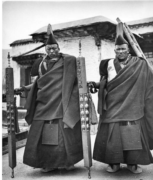
נזירי דוב-דוב - לאסה 1938

במסגרת אותם מנזרים גדולים בטיבט היו קבוצות נזירים מיוחדות. הן נבנו מאותם נערים-נזירים שחיי הנזירות הנוקשים לא התאימו להם. כאלו שלא יכלו ללכת לפי כללי המנזר וחשקו בתענוגות החיים האזרחיים. הם נקראו דוב-דוב והמילים "נזירים פרחחים" מתאימות בשביל לתאר אותם. הם היוו עשרה אחוז מכלל הנזירים והיחס כלפיהם היה שונה מי לשאר הנזירים ומאוד סובלני.